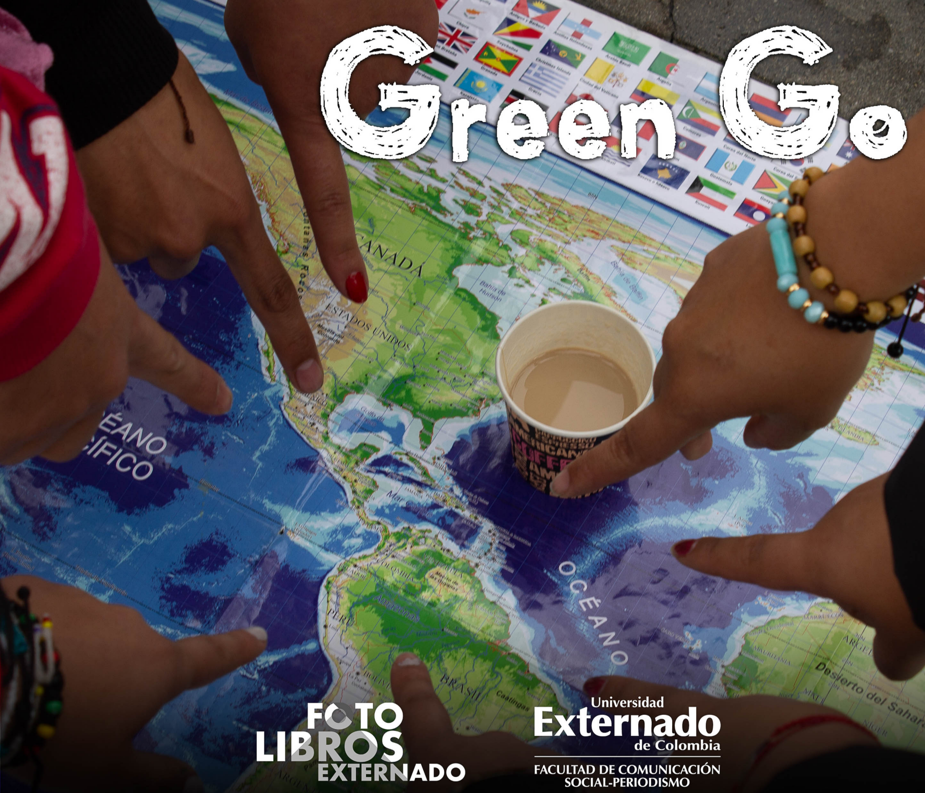
FOTO LIBROS EXTERNADO